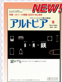
特集:ホイール情報/注目のMg技術